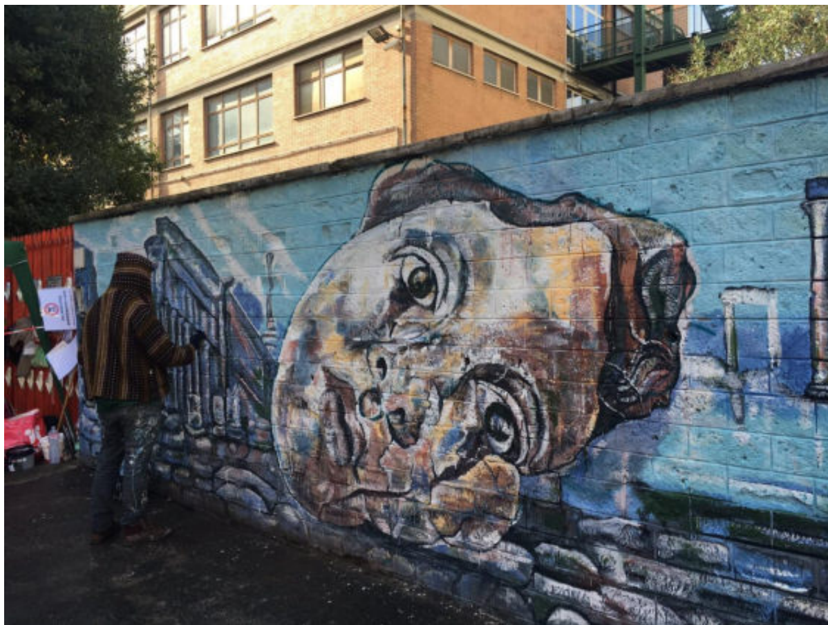
Carlos Atocha "Muri sicuri" Via Laparelli, Roma

"La pittura è più forte di me; mi costringe a dipingere come vuole lei."